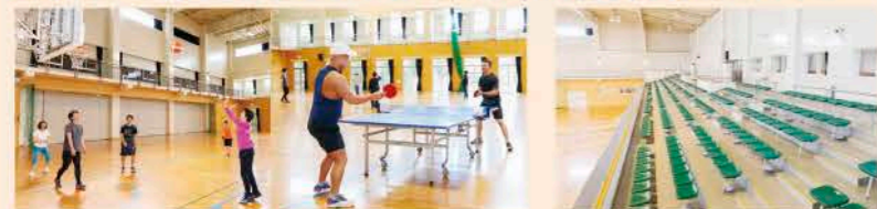
卓球・バドミントン・バスケットボールなどを楽しめます。観客席も充分にご用意。