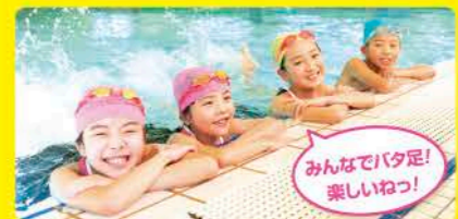
みんなでバク足! 楽しいねっ!